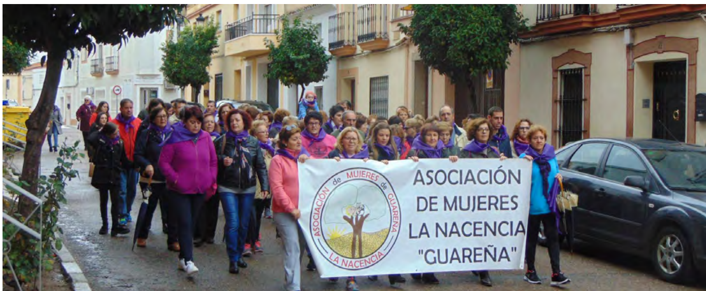
TRAMO DE LA MANIFESTACIÓN CONTRA EL MALTRATO HACIA LA MUJER EL 25 DE NOVIEMBRE DE 2018

El 25 de noviembre se celebraba el Día Internacional para la eliminación de la Violencia hacia la Mujer. Desde el Ayuntamiento de Guareña se organizó, junto con la Mancomunidad Integral Municipios "Guadiana" y la Asociación de Mujeres La Nacencia, un programa de actuaciones y una campaña de sensibilización hacia la violencia que las mujeres sufren. El maltrato y el machismo son lacras que debemos paliar y está en el conjunto de la sociedad hacerlo posible.