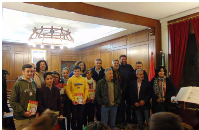
ALUMNOS DEL CP SAN GREGORIO, EL I.E.S. EUGENIO FRUTOS Y DEL COLEGIO CONCERTADO NUESTRA SEÑORA DE LOS DOLORES JUNTO AL ALCALDE, LOS CONCEJALES Y LOS PORTAVOCES DE LOS GRUPOS POLÍTICOS CON REPRESENTACIÓN EN PLENO MUNICIPAL

El Ayuntamiento celebró el pasado 5 de diciembre en el Salón de Plenos el cuarenta aniversario de la Constitución Española que se aprobó en 1978. Niños y niñas del C.P. San Gregorio, el Colegio Concertado Nuestra Señora de los Dolores y el I.E.S. Eugenio Frutos participaron en el acto con la lectura del articulado de la Constitución. Junto a ellos, los portavoces de los grupos políticos con representación en Pleno Municipal quisieron añadir sus lecturas sobre la constitución vigente.