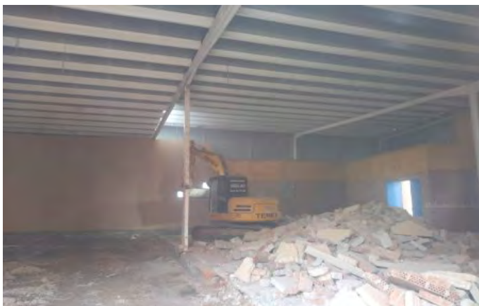
OBRAS EN EL NUEVO GIMNASIO MUNICIPAL

Por otro lado, las obras del nuevo gimnasio municipal también comenzaron el pasado mes, Se trata de obras de adecuación de edificio para uso como gimnasio urbano. Este proyecto contará con una subvención de 30.000 euros para maquinaria y con un espacio reservado para asociaciones de Guareña que por sus necesidades específicas necesitan de una sala de terapia que se ubicará aquí. El edificio del gimnasio urbano municipal se sitúa en la Calle Teresa de Calcuta, frente a la gasolinera. Un edificio que se reutilizará para dicha actividad deportiva y social ya que el actual gimnasio tiene dimensiones inferiores para cubrir las necesidades de la población.