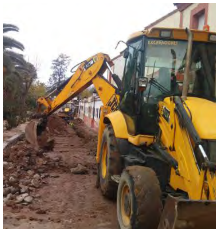
OBRAS EN EL BARRIO SAN GINÉS

Otras obras que aún no han comenzado, pero que están ya planteadas son las obras de saneamiento entre las calles El Royo con José Echegaray, donde se realizará un aliviadero que conecte el saneamiento entre las calles. Los vecinos que residen en esta zona han comunicado, igual que los vecinos de San Ginés, problemas con las filtraciones de agua que dañan las viviendas. Junto con esta obra se plantea otra, que consiste en otro aliviadero entre la Avenida de Don Benito con Luis Cernuda, que quite presión al anterior. Este proyecto ha sido planteado desde el Ayuntamiento de Guareña a demanda de los vecinos y que será financiado con un Plan de Emergencia que se ha solicitado a la Diputación de Badajoz para estos problemas vecinales.