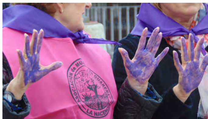
MANOS VIOLETAS CONTRA EL MALTRATO

LLAMA AL TELÉFONO GRATUITO 016 SI VIVES SITUACIONES DE VIOLENCIA DE GÉNERO