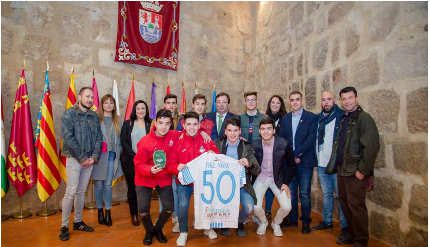
EL CP GUAREÑA ENTREGA UNA CAMISETA CONMEMORATIVA DEL 50 ANIVERSARIO DEL CLUB AL PRESIDENTE DE LA JEX