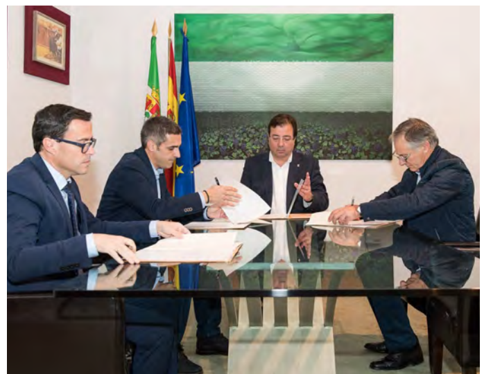
FIRMA DEL PROTOCOLO DE NEGOCIACIÓN ENTRE GUAREÑA Y TORREFRESNEDA CON EL PRESIDENTE DE LA JEX

LOS PRESUPUESTOS PARA 2019 SUBEN UN 8,4% CON RESPECTO A LOS DEL PASADO AÑO. UN INCREMENTO DE 409.285 EUROS. UN TOTAL DE 7.700.629 EUROS ENTRE LAS CUENTAS DE LA CORPORACIÓN MUNICIPAL Y LA AGROPECUARIA MUNICIPAL AMGSA